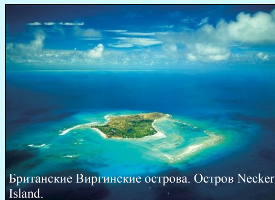
Британские Виргинские острова. Остров Necker Island.

Самый дорогой отдых в мире. 30 тыс.$ /ночь