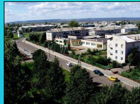
Вид поселка Алексеевское, 1992 год.

Зеленый цвет – символ природы, здоровья, экологии, жизненного роста.